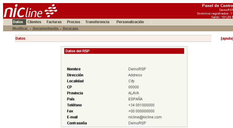
Panel de Control de RSP

El Panel de Control de RSP está destinado a la creación y administración de cuentas de distribuidores e incluye las siguientes funcionalidades: